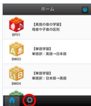
図 1. ホーム画面