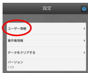
図 2. 設定