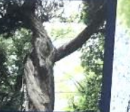
樹齢800年の神木 ハウススポット 換柏(シンバク)