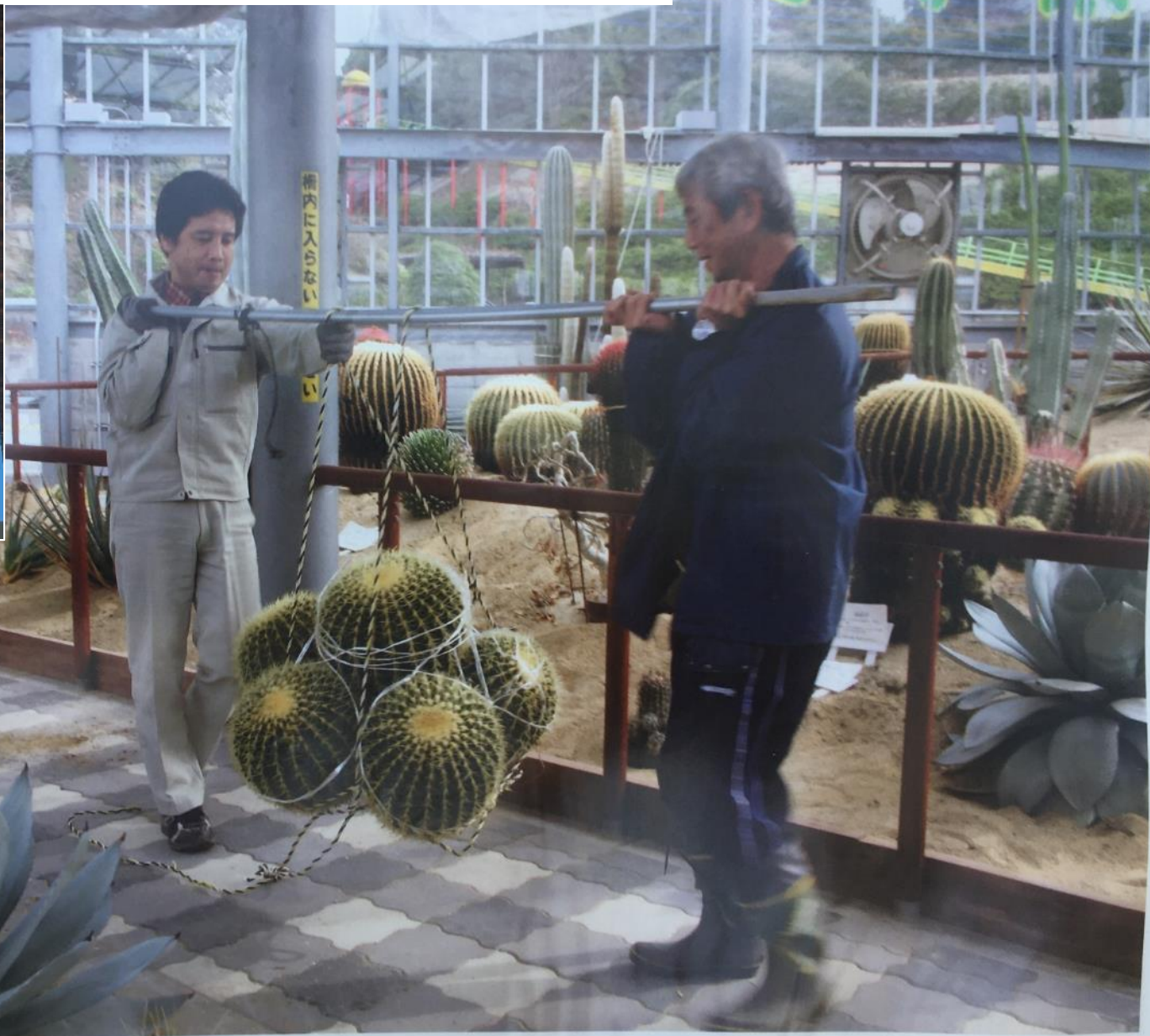
サポテン い どう よう す を移動する様子