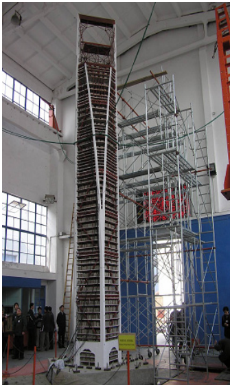
上海环球金融中心(高度:490米) 抗震試験

※中国ドイツ学部、中国フランス経営工学部、中国ドイツ応用化学部、中国イタリア学部、同济大学オーストラリア科学技術学部、国連環境計画-持続可能な発展学部、UNESCO 賛助下のアジア太平洋地区世界遺産研究センター等。