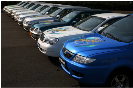
同济大学研制的燃料电池新能源汽车

現在、理学、工学、医学、文学、法学、経済学、経営管理学、哲学、教育学との9つの学部を持ちます。