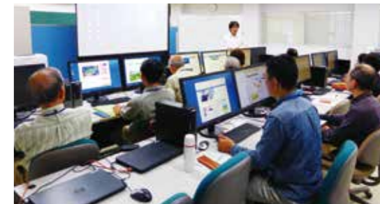
「コンピュータ入門」講義