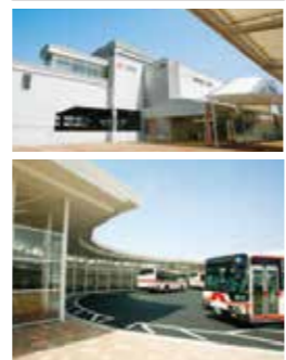
神領駅前のスクールバスのりば