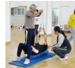
「健康増進実習」運動実習

中部大学の教員による講義を中心として、2年で学習します。授業は午前中を中心に、無理なく学習できます。