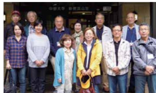
オリエンテーション合宿

シニア大学(CAAC)の2年間のカリキュラムは、シニアの皆さんが健康で豊かなセカンドライフを送り、地域社会のリーダーとして活躍できるような内容となっています。CAACで学んで多くの仲間を作り、地域に役立つ人材として、充実したセカンドライフを手に入れましょう。